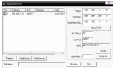
Upgrade Tool prozor

Za konfigurisanje kamere potrebno je instalirati softver koji možete preuzeti sa interneta ili ga možete naći na CD disku koji ste dobili uz kameru. Softver na CD disku se nalazi na sledećoj putanji: CD->English->Software. Tu odaberite i pokrenite Upgrade Tool da biste instalirali program na Vaš računar. Kada se instalacija završi, pokrenite program Upgrade Tool, pritisnite "IP Search" i biće Vam prikazana IP adresa vaše kamere.