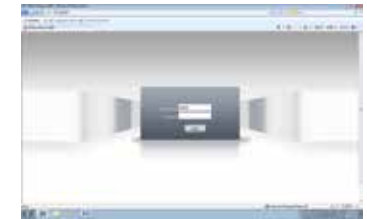
Prikaz pre prijave (gore) i posle (dole) prijave.

Otvorite Internet Explorer, zatim ukucajte IP adresu i pritisnite enter, ukucajte korisničko ime i lozinku. Sada možete da pristupite vašoj IP kameri.