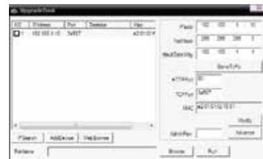
Upgrade Tool prozor

Za konfigurisanje kamere potrebno je instalirati softver koji možete preuzeti sa interneta ili ga možete naći na CD disku koji ste dobili uz kameru. Softver na CD disku se nalazi na sledećoj putanji: CD->English->Software. Tu odaberite i pokrenite Upgrade Tool da biste instalirali program na Vaš računar. Kada se instalacija završi, pokrenite program Upgrade Tool, pritisnite "IP Search" i biće Vam prikazana IP adresa vaše kamere.