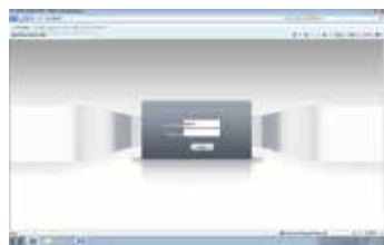
Prikaz pre prijave (gore) i posle (dole) prijave.

Otvorite Internet Explorer, zatim ukucajte IP adresu i pritisnite enter, ukucajte korisničko ime i lozinku. Sada možete da pristupite vašoj IP kameri.