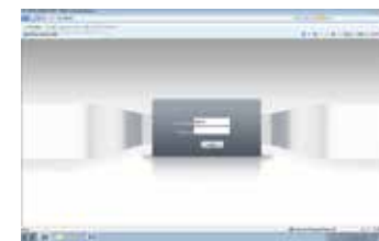
Prikaz pre prijave (gore) i posle (dole) prijave.

Otvorite Internet Explorer, zatim ukucajte IP adresu i pritisnite enter, ukucajte korisničko ime i lozinku. Sada možete da pristupite vašoj IP kameri.