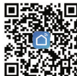
Smart Life aplikacija