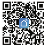
Smart Life aplikacija

8. Putem aplikacije možete početi sa podešavanjem Wi-Fi sirene.