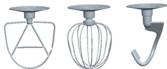
Mutilica Mešalica Mutilica za testo